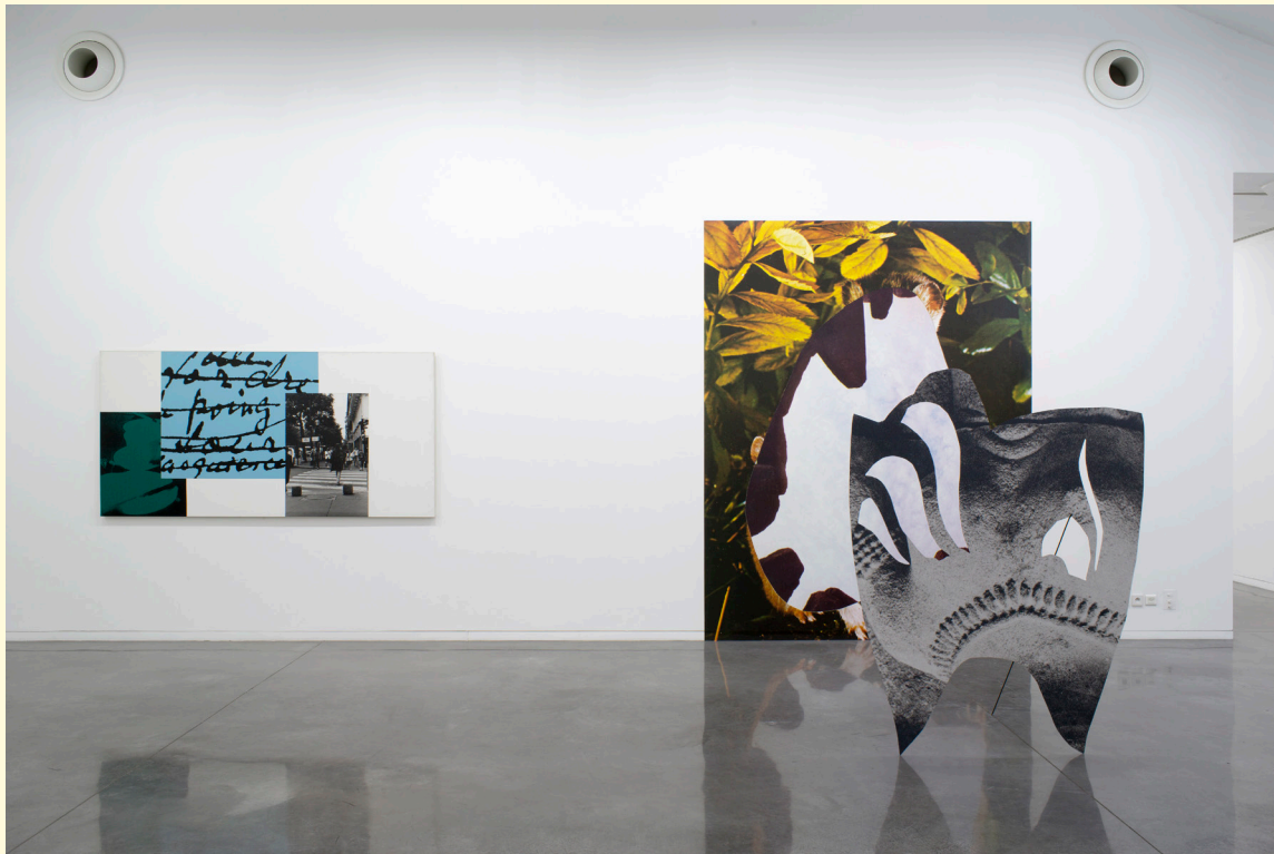
Vues de l'exposition «Bandes à part» Mrac Occitanie, Sérignan, 2018.